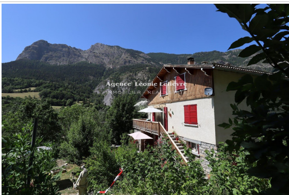
Huis Colmars - Ref. V3297M - Mandaat n°2185

Op 5 minuten lopen van het dorp Colmars, groot familiehuus met 2 aparte woongedeeltes en een prachtige tuin met moestuin en uitzicht op de bergen. U zult de ligging op het zuidwesten van dit huis en de helderheid ervan waarderen. Op het gelijkvloers, een 1ste leefruimte die onafhankelijk kan zijn met woonkamer/open keuken, 2 slaapkamers en 1 douchekamer. Op de begane grond is er ook een kleine werkplaats. Hierboven vindt u de tweede leefruimte met op niveau 1 een woongedeelte, woonkamer en keuken communicerend. De woonkamer heeft een prachtige open haard met een zeer nuttige houtinzet in de winter. De keuken is voorzien van gaskookplaat, oven, koelkast/vriezer en vaatwasser. Ditzelfde niveau omvat een badkamer en 1 slaapkamer/kantoor. Boven op niveau 2 zijn er 2 slaapkamers op het zuiden, een doucheruimte en een wasruimte en een bergzolder. Tevens is er op deze verdieping een viering bereikbaar voor opslag. De verwarming gebeurt op hout met de inzet, door de centrale verwarming op stookolie of door de elektrische radiatoren met inertie. De diagnose classificeert de woning vanwege de olietel in E, maar alleen op het onderdeel Isolatie in D. Er is door de eigenaren in deze richting gewerkt. De